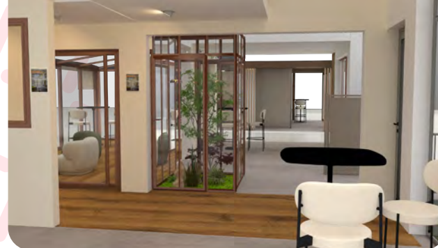
Vue intérieure stand 2026 - Verrière Indoor Factory®